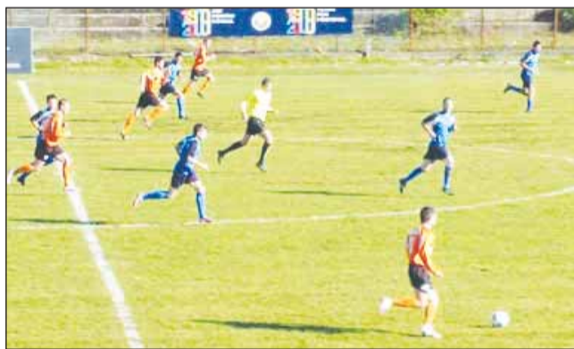
Trupa lui Hanc își joacă ultima carte astăzi, pe teren propriu

Golul egalizator a dat speranțe în tabăra gaziștilor. Aceștia nu s-au bucurat însă prea mult. Peste doar șapte minute, maramureșenii au înscris din nou. Pop a centrat perfect