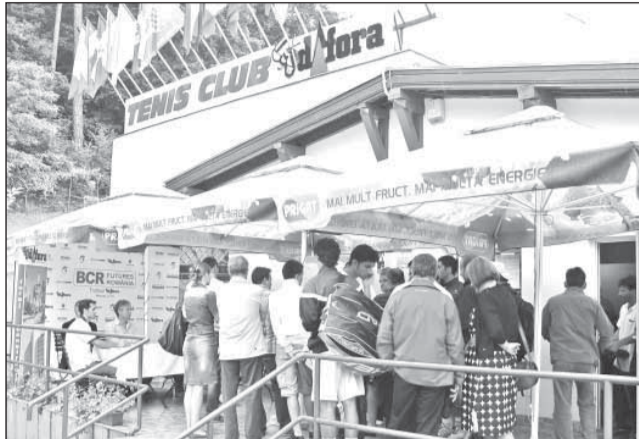
Peste 100 de sportivi, din 34 de țări, se întrec în aceste zile la Baza Dafora Mișcare națională

Pe lângă popularizarea sportului ca factor de educație pentru copii și promovarea valorilor naționale și locale în tenis, evenimentul își propune și să promoveze imaginea în lume a zonei Mediașului, având în vedere numărul mare de țări participante an de an. Turneul este organizat de Clubul Sportiv „Pro AS” Sibiu, în parteneriat cu Primăria municipiului Mediaș, prin Direcția Municipală pentru Cultură, Sport, Turism și Tineret, și susținut de SNTGN Transgaz S.A. și Andu.