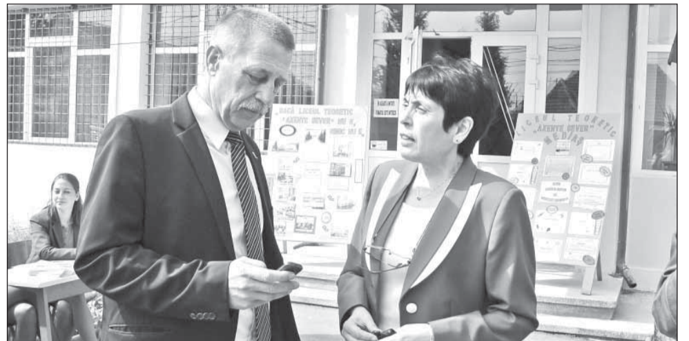
Elevii vor putea opta în premieră, din toamnă, pentru o clasă cu profil sportiv, la Liceul Teoretic „Axente Sever”.

Noutatea anului de învățământ 2011-2012, la Liceul Teoretic „Axente Sever”, este o clasă cu profil sportiv de 30 de locuri. Unitatea de învățământ a fost evaluată de către Agenția Națională pentru Autorizare în Învățământul Preuniversitar și a îndeplinit toți